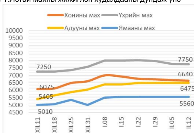
Зураг 1. Ястай махны жижиглэн худалдааны дундаж үнэ

Гурилын үнэ: 2014 оны 2-р сарын 12-ны байдлаар дээдийн дээд зэргийн савласан гурилын үнэ өмнөх сарынхаас 6.8 хувиар өсч, дээд зэргийн савласан гурил 0.4 хувиар буурч, 1-р зэргийн задгай гурил, 2-р зэргийн гурилын үнэ өөрчлөлтгүй байна.