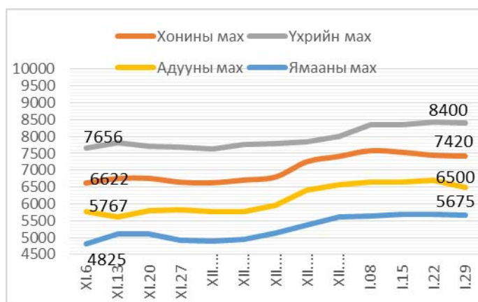
Зураг 1. Ястай махны жижиглэн худалдааны дундаж үнэ Зураг 2. Цул махны жижиглэн худалдааны дундаж үнэ

2014 оны 1-р сарын 29-ны байдлаар 1 кг хонины /ястай/ мах дунджаар 7420 төгрөг, хонины цул мах 7450 төгрөг, үхрийн /ястай/ мах 8400 төгрөг, үхрийн цул мах 9900 төгрөг, адууны мах 6500 төгрөг, ямааны мах 5675 төгрөгийн үнэтэй байв(Зураг 1; 2).