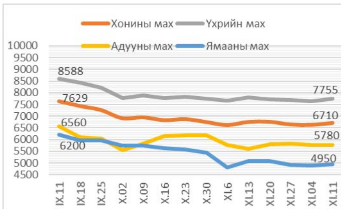
Зураг 1. Ястай махны жижиглэн худалдааны дундаж үнэ Зураг 2. Цул махны жижиглэн худалдааны дундаж үнэ

2013 оны 12-р сарын 11-ний байдлаар 1 кг хонины /ястай/ мах дунджаар 6710 төгрөг, хонины цул мах 6780 төгрөг, үхрийн /ястай/ мах 7755 төгрөг, үхрийн цул мах 9020 төгрөг, ямааны мах 4950 төгрөг, адууны мах 5780 төгрөгийн үнэтэй байв (Зураг 1; 2).