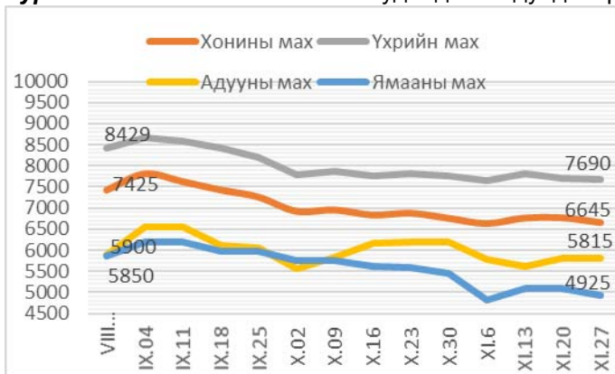
Зураг 1. Ястай махны жижиглэн худалдааны дундаж үнэ Зураг 2. Цул махны жижиглэн худалдааны дундаж үнэ

2013 оны 11-р сарын 27-ны байдлаар 1 кг хонины /ястай/ мах дунджаар 6645 төгрөг, хонины цул мах 6800 төгрөг, үхрийн /ястай/ мах 7690 төгрөг, үхрийн цул мах 9080 төгрөг, ямааны мах 4925 төгрөг, адууны мах 5815 төгрөгийн үнэтэй байв (Зураг 1; 2).