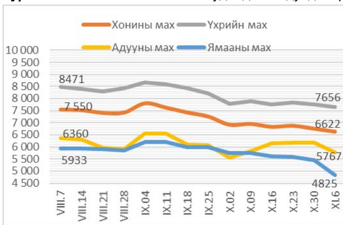
Зураг 1. Ястай махны жижиглэн худалдааны дундаж үнэ Зураг 2. Цул махны жижиглэн худалдааны дундаж үнэ

2013 оны 11-р сарын 6-ны байдлаар 1 кг хонины /ястай/ махны үнэ дунджаар 6622 төгрөг, хонины цул мах 7080 төгрөг, үхрийн /ястай/ мах 7656 төгрөг, үхрийн цул мах 9278 төгрөг, ямааны мах 4825 төгрөг, адууны мах 5767 төгрөгийн үнэтэй байв (Зураг 1; 2).