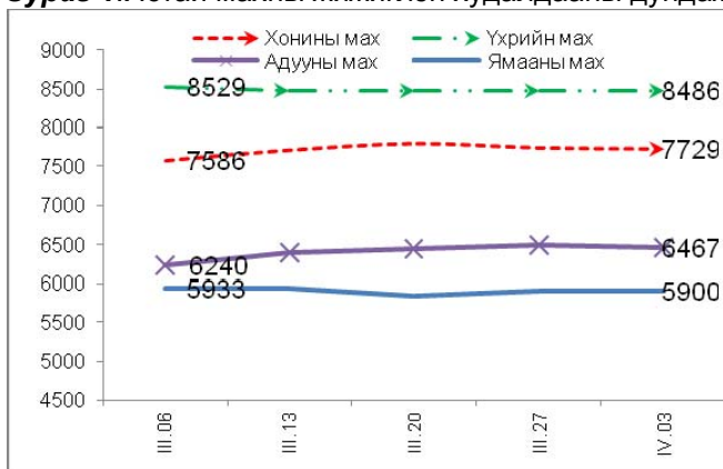
Зураг 1. Ястай махны жижиглэн худалдааны дундаж үнэ Зураг 2. Цул махны жижиглэн худалдааны дундаж үнэ

2013 оны 4-р сарын 3-ны байдлаар 1 кг хонины /ястай/ махны үнэ дунджаар 7729 төгрөг, хонины цул мах 7700 төгрөг, үхрийн /ястай/ мах 8486 төгрөг, үхрийн цул мах 9571 төгрөг, ямааны мах 5900 төгрөг, адууны мах 6467 төгрөгийн үнэтэй байлаа (Зураг 1; 2).