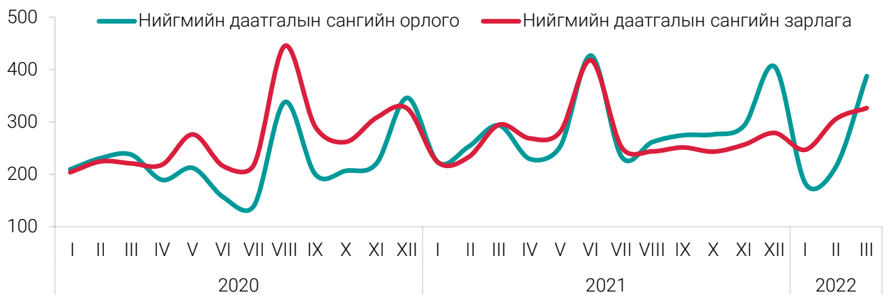
ЗУРАГ 1. НИЙГМИЙН ДААТГАЛЫН САНГИЙН ОРЛОГО, ЗАРЛАГА, тэрбум төгрөгөөр, сараар

Монгол Улсын Засгийн газрын 2022 оны 63 дугаар тогтоолоор Нийгмийн даатгалын сангаас олгож байгаа болон цэргийн алба хаасны тэтгэвэр авагчийн авч байгаа тэтгэврийн хэмжээг 15 хувиар тус тус нэмэгдүүлэн Нийгмийн даатгалын сангаас олгох бүрэн тэтгэврийн болон цэргийн алба хаасны тэтгэврийн доод хэмжээг 500000 (таван зуун мянган) төгрөгөөр, нийгмийн даатгалын сангаас олгох хувь тэнцүүлэн тогтоосон тэтгэврийн доод хэмжээг 400000 (дөрвөн зуун мянган) төгрөгөөр тус тус шинэчлэн тогтоосон.