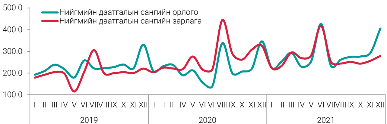
ЗУРАГ 1. НИЙГМИЙН ДААТГАЛЫН САНГИЙН ОРЛОГО, ЗАРЛАГА, тэрбум төгрөгөөр, сараар

Нийгмийн даатгалын сангийн зарлага 2021 онд 3245.3 тэрбум төгрөг болж, өмнөх оноос 35.3 (1.1%) тэрбум төгрөгөөр өсөхөд тэтгэврийн даатгалын сангийн зарлага 125.5 (5.8%) тэрбум төгрөгөөр, эрүүл мэндийн даатгалын сангийн зарлага 85.9 (26.7%) тэрбум төгрөгөөр өссөн нь голлон нөлөөлөв. Харин үйлдвэрлэлийн осол, мэргэжлээс шалтгаалах өвчний даатгалын сангийн зарлага өмнөх оноос 163.9 (34.9%) тэрбум төгрөгөөр буурсан байна.