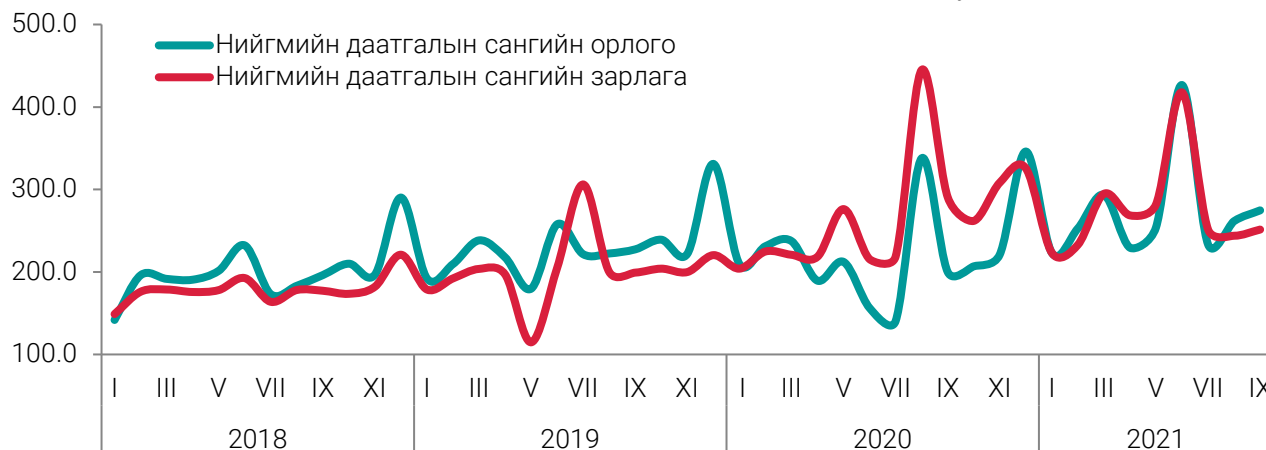
ЗУРАГ 1. НИЙГМИЙН ДААТГАЛЫН САНГИЙН ОРЛОГО, ЗАРЛАГА, тэрбум төгрөгөөр, сараар

Нийгмийн даатгалын сангийн зарлага 2021 оны эхний 9 сард 2466.3 тэрбум төгрөг болж, өмнөх оны мөн үеэс 152.1 (6.6%) тэрбум төгрөгөөр өсөхөд тэтгэврийн даатгалын сангийн зарлага 103.5 (6.4%) тэрбум төгрөгөөр, эрүүл мэндийн даатгалын сангийн зарлага 68.6 (31.6%) тэрбум төгрөгөөр өссөн нь голлон нөлөөлөв.