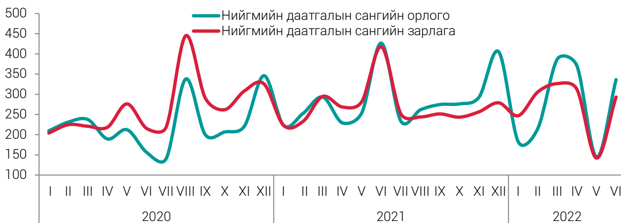
ЗУРАГ 1. НИЙГМИЙН ДААТГАЛЫН САНГИЙН ОРЛОГО, ЗАРЛАГА, сараар, тэрбум төгрөгөөр

Нийгмийн даатгалын сангийн зарлага 2022 оны эхний хагас жилд 1626.9 тэрбум төгрөг болж, өмнөх оноос 90.7 (5.9%) тэрбум төгрөгөөр өсөхөд тэтгэврийн даатгалын сангийн зарлага 355.3 (31.2%) тэрбум төгрөгөөр, ажилгүйдлийн даатгалын сангийн зарлага 6.8 (24.9%) тэрбум төгрөгөөр өссөн нь голлон нөлөөлөв.