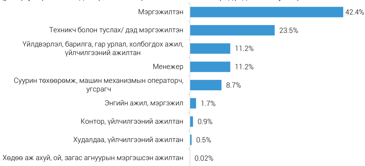
ЗУРАГ 2. ХӨДӨЛМӨРИЙН ГЭРЭЭГЭЭР АЖИЛ ЭРХЭЛЖ БУЙ ГАДААДЫН ИРГЭД, 2022 оны 2 дугаар улирлын байдлаар, ажил мэргэжлийн ангиллаар, дүнд эзлэх хувиар

Манай улсад 2022 оны 2 дугаар улиралд ажил эрхэлж буй гадаад иргэдийн 2029 (32.7%) нь уул уурхай, олборлолтын, 1585 (25.5%) нь барилгын, 641 (10.3%) нь боловсруулах үйлдвэрлэлийн, 637 (10.3%) нь боловсролын, 410 (6.6%) нь бөөний болон жижиглэн худалдаа, машин, мотоциклийн засвар үйлчилгээний, 335 (5.4%) нь тээвэр ба агуулахын үйл ажиллагааны, 569 (9.2%) нь бусад салбарт ажиллаж байна. Өмнөх улиралтай харьцуулахад, тухайлбал барилгын салбарт 479 (43.3%) хүнээр өсөж, боловсролын салбарт ажил эрхэлж буй гадаадын иргэд 111 (14.8%) хүнээр буурсан байна.