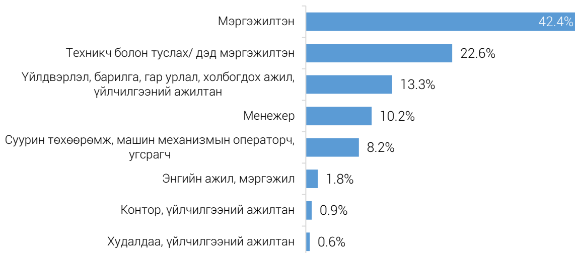
ЗУРАГ 2. ХӨДӨЛМӨРИЙН ГЭРЭЭГЭЭР АЖИЛ ЭРХЭЛЖ БУЙ ГАДААДЫН ИРГЭД, ажил мэргэжлийн ангиллаар, дүнд эзлэх хувиар, 2022 оны 3 дугаар улирлын байдлаар

Манай улсад 2022 оны 3 дугаар улиралд ажил эрхэлж буй гадаад иргэдийн 2187 (31.1%) нь уул уурхай, олборлолтын, 1641 (23.3%) нь барилгын, 866 (12.3%) нь боловсролын, 748 (10.6%) нь боловсруулах үйлдвэрлэлийн, 513 (7.3%) нь бөөний болон жижиглэн худалдаа, машин, мотоциклийн засвар үйлчилгээний, 419 (6.0%) нь тээвэр ба агуулахын үйл ажиллагааны, 205 (2.9%) нь үйлчилгээний бусад үйл ажиллагааны, 455 (6.5%) нь бусад салбарт ажиллаж байна. Ажил эрхэлж буй гадаад иргэд өмнөх улиралтай харьцуулахад боловсрол (229 хүнээр), уул уурхай олборлолтын салбарт (158 хүнээр) хамгийн их нэмэгдсэн байна.