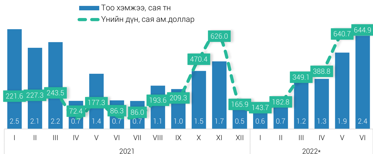
ЗУРАГ 3. НҮҮРСНИЙ ЭКСПОРТЫН БИЕТ ХЭМЖЭЭ БОЛОН ҮНИЙН ДҮН, сараар

2022 оны эхний хагас жилийн байдлаар импортын дүнг авч үзвэл, БНХАУ 35.1%, ОХУ 30.7%, Япон 8.5%, БНСУ 4.9%, Америк 2.3%, Герман 2.1 хувийг тус тус эзэлж, нийт импортын 83.6 хувийг бүрдүүлж байна.