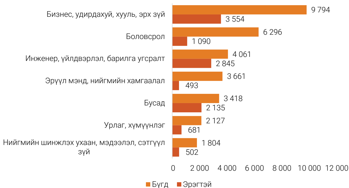
ЗУРАГ 3. ДОТООДЫН ИХ, ДЭЭД СУРГУУЛЬ, КОЛЛЕЖИЙГ ТӨГСӨГЧИД, мэргэжлийн чиглэлээр, хүйсээр