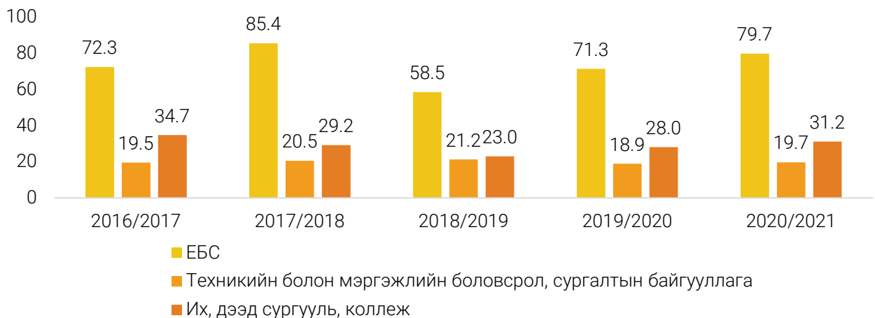
ЗУРАГ 1. БҮХ ШАТНЫ СУРГАЛТЫН БАЙГУУЛЛАГЫГ ТӨГСӨГЧИД, сургалтын байгууллагын ангиллаар, мянган хүн

Техникийн болон мэргэжлийн боловсрол, сургалтын байгууллагыг 2020/2021 оны хичээлийн жилд 19.7 мянган оюутан төгссөн нь өмнөх оны хичээлийн жилээс 847 (4.5%)-гоор нэмэгдсэн байна. Нийт төгсөгчдийн 55.2 хувь нь эрэгтэйчүүд байна.