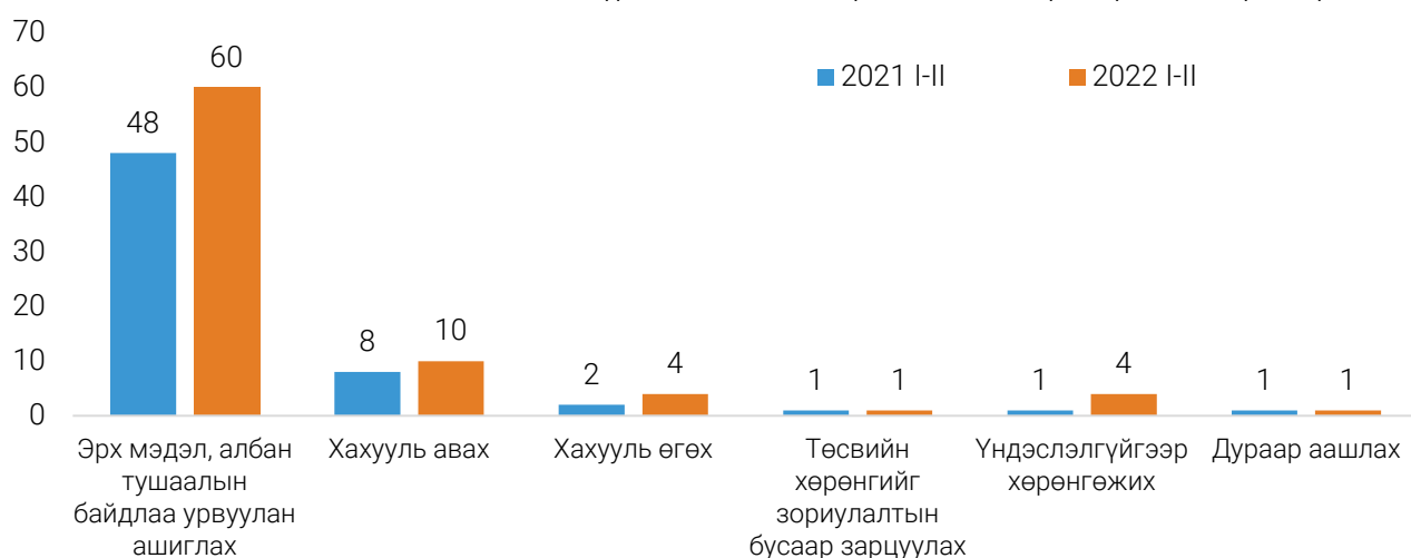
ЗУРАГ 4. АВЛИГЫН ГЭМТ ХЭРЭГ, жил бүрийн эхний 2 сарын байдлаар, хэргийн төрлөөр

Бүртгэгдсэн 77 авлигын хавтаст хэргийг Монгол Улсын Эрүүгийн хуулийн 22 дугаар бүлгийн зүйлээр ангилахад 60 (75.0%) нь эрх мэдэл, албан тушаалын байдлаа урвуулан ашиглах, 10 (12.4%) нь хахууль авах гэмт хэрэг, 4 (5.0%) нь хахууль өгөх гэмт хэрэг, 4 (5.0%) нь үндэслэлгүйгээр хөрөнгөжих гэмт хэрэг, 1 (1.3%) нь дураараа аашлах гэмт хэрэг, 1 (1.3%) нь төсвийн хөрөнгийг зориулалтын бусаар зарцуулах гэмт хэрэг байна.