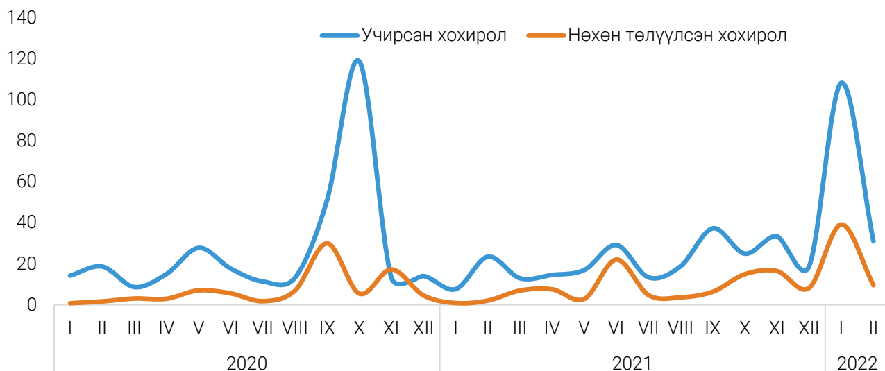
ЗУРАГ 2. УЧИРСАН ХОХИРОЛ БОЛОН НӨХӨН ТӨЛҮҮЛСЭН ХОХИРОЛ, сараар, тэрбум төгрөгөөр

Гэмт хэргийн улмаас учирсан хохирол 2022 оны эхний 2 сард 142.0 тэрбум төгрөг, нөхөн төлүүлсэн хохирлын хэмжээ 49.2 тэрбум төгрөг болж, өмнөх оны мөн үеэс учирсан хохирол 110.6 (4.5 дахин) тэрбум төгрөгөөр, нөхөн төлүүлсэн хохирол 46.3 (16.9 дахин) тэрбум төгрөгөөр тус тус өссөн байна.