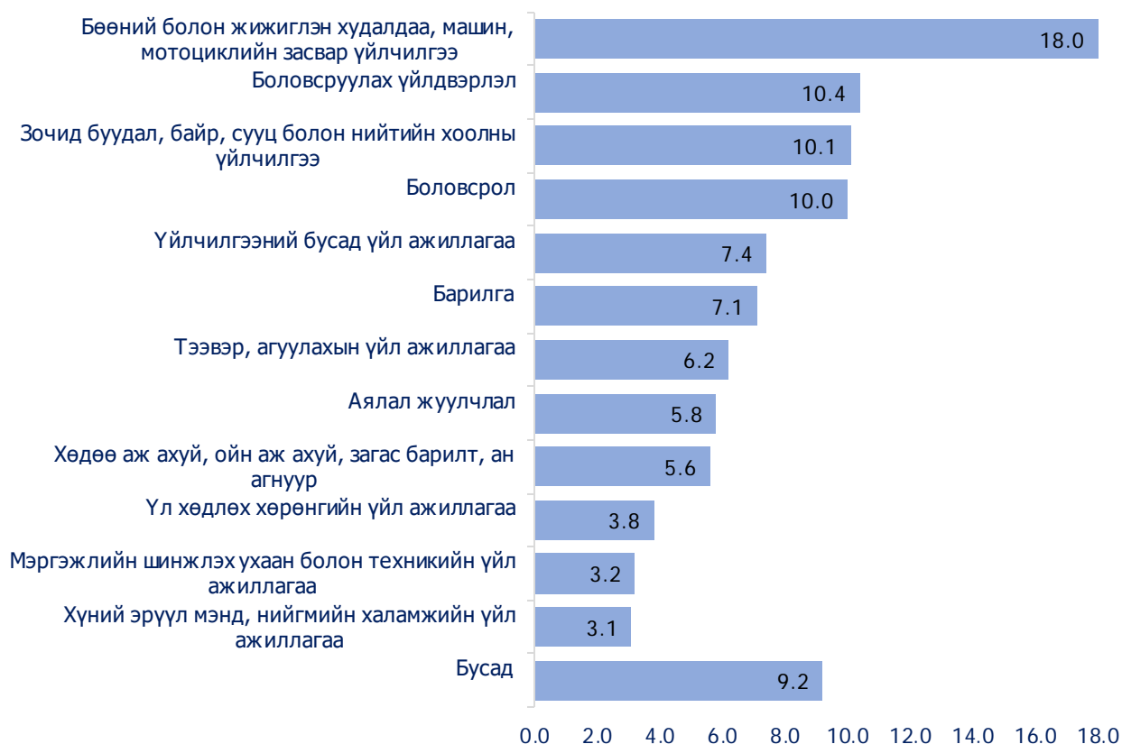
Зураг 1. Үйл ажиллагаа хэвийн явагдахгүй байгаа аж ахуйн нэгж, салбараар