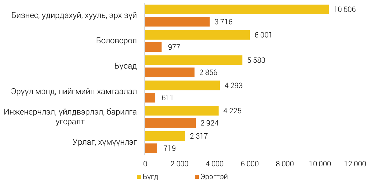
ЗУРАГ 3. ДОТООДЫН ИХ, ДЭЭД СУРГУУЛЬ, КОЛЛЕЖИЙГ ТӨГСӨГЧИД, мэргэжлийн чиглэлээр, хүйсээр

Их, дээд сургууль, коллеж төгсөгчдийн мэргэжлийн тэргүүлэх чиглэлийг харахад Бизнес, удирдахуй, хууль, эрх зүй, Боловсрол тэргүүлж байна. Төгсөгчдийг хүйсээр авч үзэхэд мэдээлэл, харилцаа, холбооны технологийн чиглэлээр 242 (72.6%), инженер, үйлдвэрлэл, барилга угсралтын чиглэлээр 2.9 (69.2%) мянга нь, үйлчилгээний чиглэлээр 1.1 (68.4%) мянга буюу төгсөгчдийн дийлэнх нь эрэгтэй, бусад салбарын хувьд эмэгтэйчүүд нь дийлэнх байна.