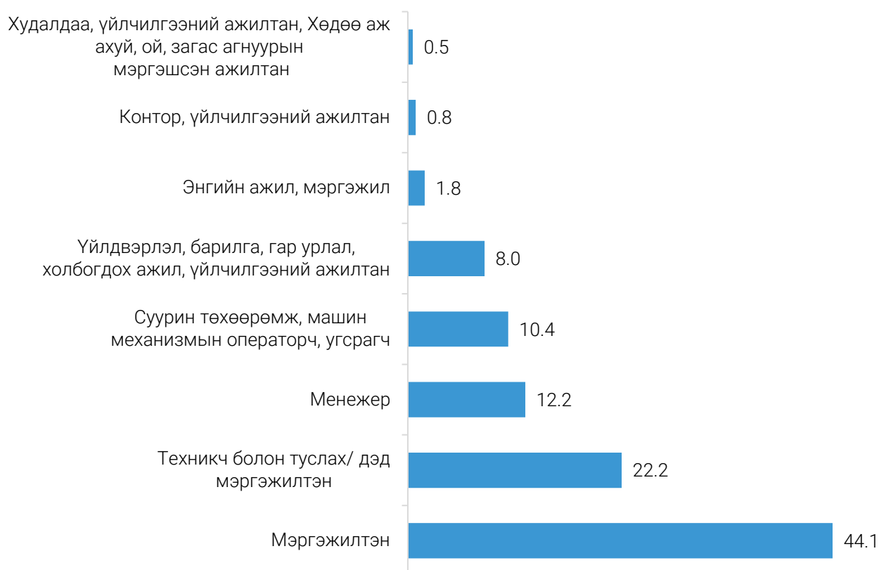
ЗУРАГ 2. ХӨДӨЛМӨРИЙН ГЭРЭЭГЭЭР АЖИЛ ЭРХЭЛЖ БУЙ ГАДААДЫН ИРГЭД, 2022 оны 1 дүгээр улирлын байдлаар, ажил мэргэжлийн ангиллаар, дүнд эзлэх хувиар

Манай улсад 2022 оны 1 дүгээр улиралд ажил эрхэлж буй гадаад иргэдийн 1836 (33.6%) нь уул уурхай, олборлолтын, 1106 (20.2%) нь барилгын, 748 (13.7%) нь боловсролын, 539 (9.9%) нь боловсруулах үйлдвэрлэлийн, 365 (6.7%) нь тээвэр ба агуулахын үйл ажиллагааны, 310 (5.7%) нь бөөний болон жижиглэн худалдаа, машин, мотоциклийн засвар үйлчилгээний, 191 (3.5%) нь үйлчилгээний бусад үйл ажиллагааны, 117 (2.1%) нь олон улсын байгууллага, суурин төлөөлөгчийн үйл ажиллагааны, 251 (4.6%) нь бусад салбарт ажиллаж байна. Өмнөх улиралтай харьцуулахад, тухайлбал боловсролын салбарт ажил эрхэлж буй гадаадын иргэд 254 (51.4%) хүнээр өсөж, барилгын салбарт 494 (30.9%) хүнээр буурсан байна.