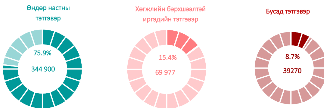
Зураг 2. Нийгмийн даатгалын сангаас тэтгэвэр авагчид, төрлөөр, 2021 оны эхний 4 сард

Нийгмийн халамжийн сангаас 2021 оны эхний 4 сард 2.2 (давхардсан тоогоор) сая хүнд 669.6 тэрбум төгрөгийн тэтгэвэр, тэтгэмж, тусламж, үйлчилгээ, хөнгөлөлт олгосон нь өмнөх оны мөн үеэс нийгмийн халамжийн үйлчилгээнд хамрагдагчид 126.2(6.0%) мянгаар, үйлчилгээнд олгосон тэтгэвэр, тэтгэмж, тусламж, үйлчилгээ, хөнгөлөлтийн хэмжээ 419.1 (2.7 дахин) тэрбум төгрөгөөр нэмэгджээ.