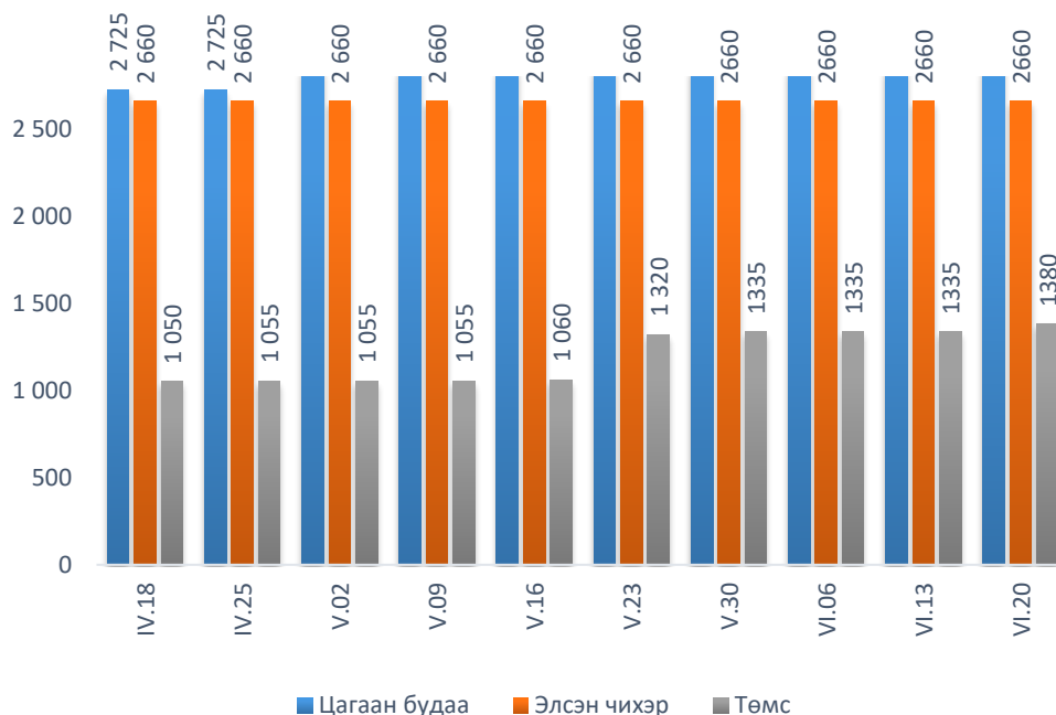
Зураг 2. Цагаан будаа, элсэн чихэр, төмсний дундаж үнэ

Төмс, хүнсний ногооны дундаж үнэ: 2018 оны 6-р сарын 20-ны байдлаар төмс, хүнсний ногооны үнийг өмнөх сарын дундаж үнэтэй харьцуулахад төмсний үнэ 19.2 хувь, хүрэн манжингийн үнэ 70.3 хувь, луувангийн үнэ 41.4 хувь, байцааны үнэ 20.7 хувиар өссөн байна. Харин сонгины үнэ 3.2 хувиар буурсан байлаа.